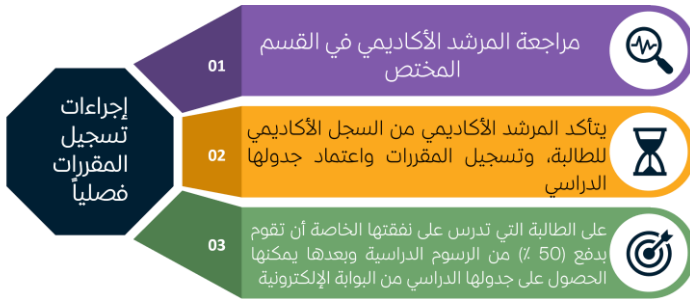
الشكل (3) : إجراءات تسجيل المقررات الدراسي

يقوم قسم القبول والتسجيل في كل فصل دراسي بالإعلان عن الإجراءات المتبعة لتسجيل المقررات ، وفق الخطوات التالية :